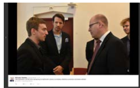
Předseda vlády Bohuslav Sobotka při své návštěvě Švédska koncem loňského roku gratuluje vědcům z CEITEC ke spolupráci s kolegy z Karolinska Institutet.

pro svůj výzkum přímo vybrali. Pográtulovat vědcům z CEITEC k této spolupráci zvládl na Karolinska Institutet i předseda vlády Bohuslav Sobotka při své návštěvě Švédska koncem loňského roku. Obdobně se pak laboratoř účastní i dlouhodobého výzkumu na italském Elettra Sincrotrone Trieste, a to v oblasti regenerativních schopností tkání a buněk plazů.