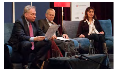
Text povídky nutil k zamyšlení nejen diváky