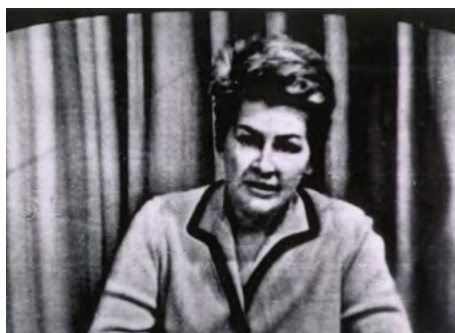
Unikátní fotografie Kamily Moučkové z vysílání Československé televize 21. srpna 1968