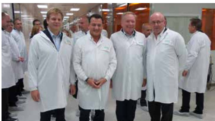
Součástí programu byla rovněž návštěva společnosti Teva Pharmaceuticals Ltd, která je světovým leaderem v oblasti farmacie