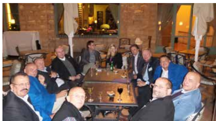
Mise nabídla příležitost i pro neformální navazování kontaktů