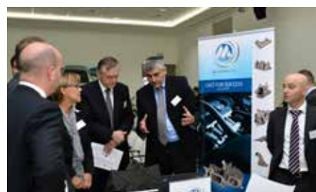
Bilaterální jednání byla velmi živá