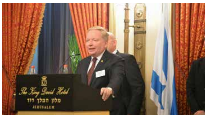
Vrcholem programu byla slavnostní večeře na počest prezidenta republiky v památném hotelu King David