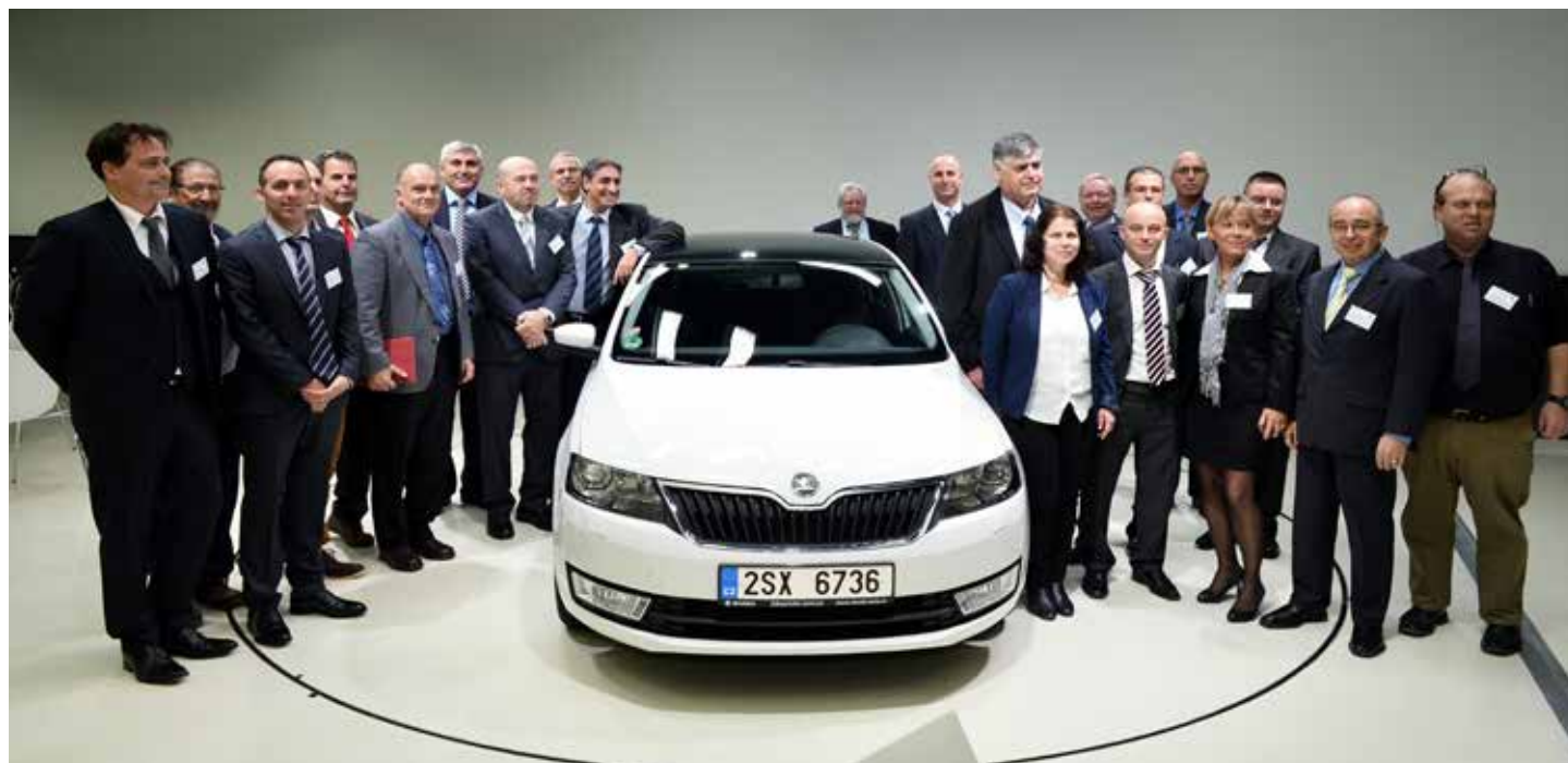
Účastníci setkání u nového modelu Škoda Rapid Hatchback