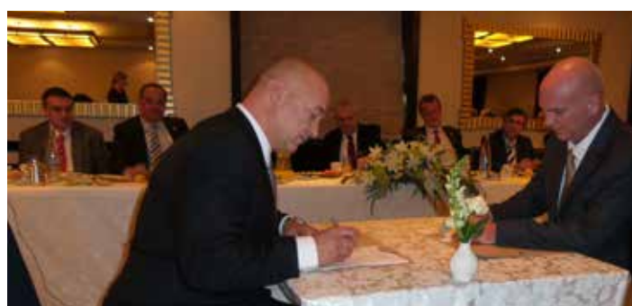
V průběhu diskusní snídaně prezidenta republiky a ministrů české vlády s účastníky mise byla podepsána dohoda mezi izraelskou společností IQC a českou certifikační společností Bohemian Certification s.r.o.