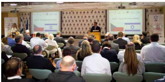
7. října 2013 proběhlo v prostorách Exportního institutu v Tel Avivu Česko-izraelské business fórum