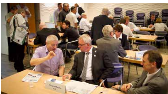
V rámci obchodního fóra se uskutečnila řada bilaterálních jednání partnerů z obou zemí