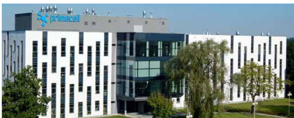
Biomedicínské centrum PrimeCell zprovozněné v roce 2016 v Ostravě.