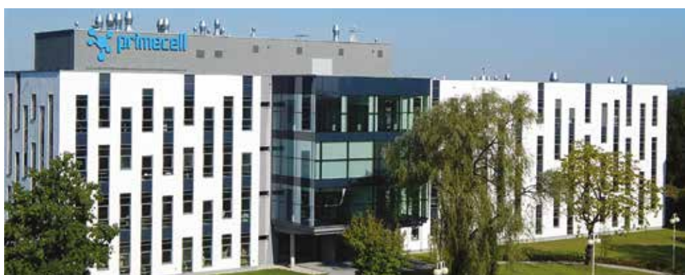
Biomedicínské centrum PrimeCell zprovozněné v roce 2016 v Ostravě.