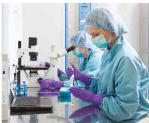
Superčisté laboratoře PrimeCell v Brně.