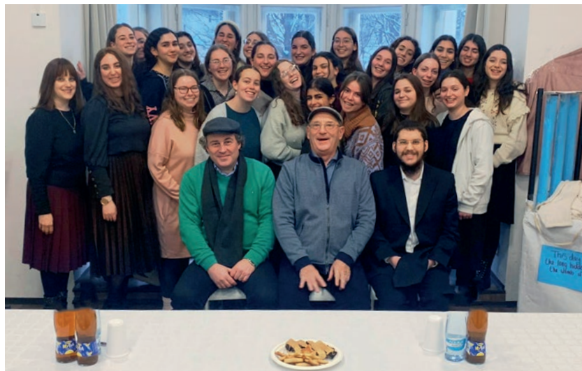
Vzdělávací program MVŠO – Mahara Institute Course je určen především mladým židovským ženám. Jeho pokračování otevírá příležitost pro propojení tradiční výchovy s novými technologiemi.

Centrum česko-izraelských inovací a partnerství (CCIIIP) bylo založeno v květnu 2021 jako součást Moravské vysoké školy Olomouc o.p.s. (MVŠO). Jeho cílem je rozvíjet česko-izraelskou spolupráci v oblasti Smart Healthcare a partnerství mezi oběma národy. Vznik CCIIIP podpořily ministerstvo zahraničních věcí, ministerstvo průmyslu a obchodu, ministerstvo zdravotnictví, Olomoucký kraj a velvyslanectví Státu Izrael v ČR. Partnery CCIIIP jsou ČISOK,